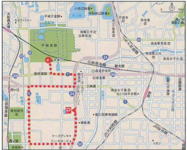
ターミナルから駐車場