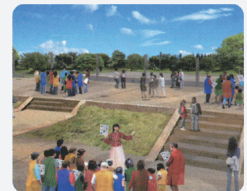
平城宮跡探訪ツアー

平城宮跡を舞台に、平城京の造営に込められた往時の世界観や国づくり・文化づくりにかけた 古代の人々の情熱や行動を体験できる。