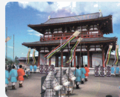
古代行事「衛士隊の再現」