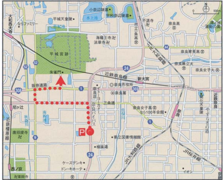
駐車場からターミナル